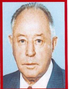
Endstation Bautzen II - erst kam der Psychoterror, dann drohte Regimegegnern die Verhaftung (l.). Der gefürchtetste Politiker der DDR, Erich Mielke (r.) organisierte als Minister für Staatssicherheit ein nahezu lückenloses Bespitzelungssystem (o.)